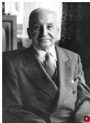
Ludwig von Mises

Auch Mises und Hayek, die zu den profiliertesten Liberalen des 20. Jahrhunderts werden sollten, begannen ihre intellektuelle Karriere, wie viele, als Sozialisten und Etatisten. „Ich bin Ökonom geworden, weil ich Sozialist war“, schreibt Hayek: „Weil ich die menschliche Vernunft überschätzt habe wie die meisten anderen: Wir sind doch intelligent genug, um uns eine bessere Welt zu schaffen.“ Der Glaube an die gesellschaftsverändernde Kraft des „social engineering“ schwand peu à peu und machte einer Skepsis gegenüber der anmaßenden Hybris menschlichen Wissens Platz.