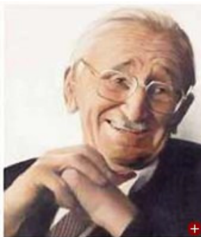
Friedrich August von Hayek

Werte, so lautet das wichtigste Prinzip der österreichischen Schule, stecken nicht objektiv in den Gütern, sondern subjektiv in den Köpfen der Menschen, die Güter und Dienstleistungen für sich bewerten. Das ist der Ausgangspunkt allen Wirtschaftens, das überhaupt nur deshalb in Gang kommt, weil den Menschen unterschiedliche Dinge eben unterschiedlich viel bedeuten. Handel heißt die Lösung für unterschiedliche Wertschätzungen (ich verkaufe dem Partner, was ihm wertvoll ist, und kriege, was mir viel bedeutet): Was die Güter wert sind, spiegelt sich im Preis. Preise sind somit nicht Ausdruck der Herstellungskosten (oder geronnener Arbeit), sondern Quantifizierung der subjektiven Wertschätzung.